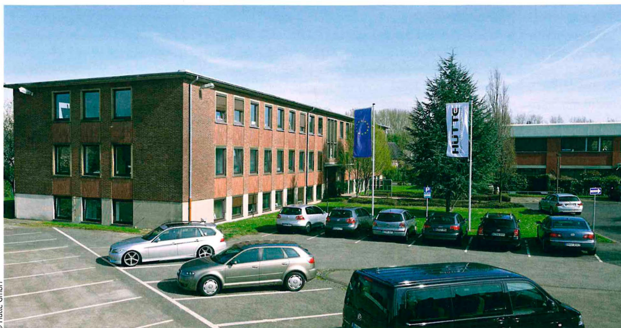
Das Verwaltungsgebäude der Hütte GmbH in Düren

Following its purchase of Hütte GmbH, an enterprise founded in early 2010, schwartz now holds more than 6,500 square metres of produc-